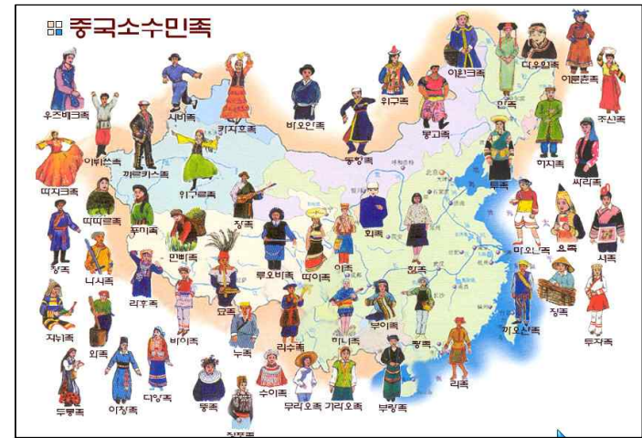
중국 천주교와 간도 교회